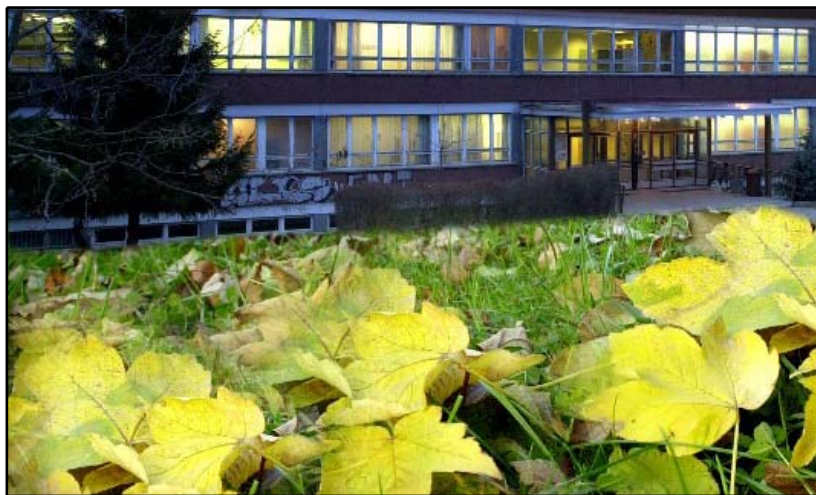
Das ehemalige Heisenberg-Gymnasium ist nun wieder belebt durch die Abendmittelschule und das Abendgymnasium.

Das zuständige Sekretariat ist Dienstag und Donnerstag von 12 bis 19 Uhr geöffnet. Weitere Informationen erhalten Sie auch auf www.abendgymnasium-chemnitz.de oder unter der Telefonnummer 0371 / 41 52 48.