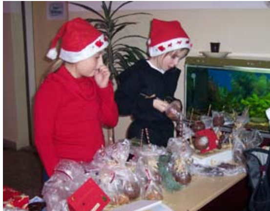
Selbstgemachte Schokoäpfel waren sehr begehrt.

„Gahr fer Gahr geht's zen Advent offn...“ Hutholzer Weihnachtsmarkt. Das ist bei vielen Bewohnern aus Hutholz und Markersdorf schon zur Tradition geworden.