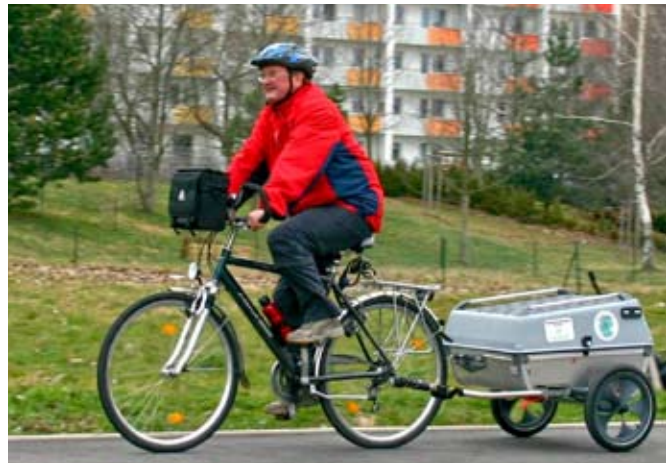
„Zum Radfahren ist niemand zu alt.“