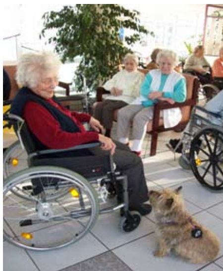
15.12.08 Besuch im AWO-Seniorenpflegeheim „Willy-Brandt-Haus“

richtungen das Glück, diesen Dienst in Anspruch nehmen zu können. Der Bedarf liegt in Chemnitz weitaus höher. Deshalb suchen die Mitglieder der Initiative weitere Mitstreiter, die in ihrer Freizeit eine sinnvolle Aufgabe übernehmen möchten. Tierliebe und Freude im Umgang mit Menschen sind dabei besonders wichtig. Auch für die Tiere gibt es einiges zu beachten.