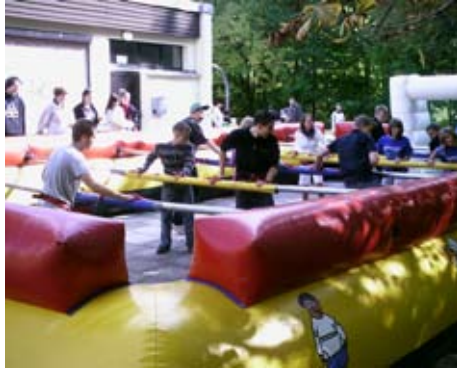
Teilnehmer aus verschiedenen Jugend-einrichtungen kämpften um den Sieg.

Am 27.09. letzten Jahres fand im Nachgang zur Fußball-EM unter Federführung der Mobilien Jugendarbeit am Klub „Würfel“ ein Menschen-Kicker-Rallye-Turnier für alle Kinder und Jugendlichen statt. Einzige Bedingung: man musste zwischen 1,40 und 2 m groß sein, um in einer Art Riesen-Tischfußball mit menschlichen Spielern mit kicken zu können. Teams zu je sechs Mitgliedern kämpften dabei um die Stadtteilmeisterschaft. Den Pokal, den das Team vom KJH Compact gewann, und die vielen Preise wurden dankenswerterweise von Firmen gesponsert