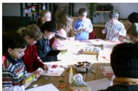
Kindertage 2008 im Gemeindezentrum der Dietrich-Bonhoeffer-Kirchgemeinde

Winterferien gehen nicht ohne unsere Kindertage! Alle Kinder zwischen 6 und 13 Jahren sind herzlich vom 6. bis 9. Februar 2009 dazu eingeladen, diese gemeinsamen Tage in unserem Gemeindezentrum zu erleben. Anmeldung bis zum 04.02.2009 im Büro der Dietrich-Bonhoeffer-Kirchgemeinde, Markersdorfer Str. 79 oder Tel.: 224197.