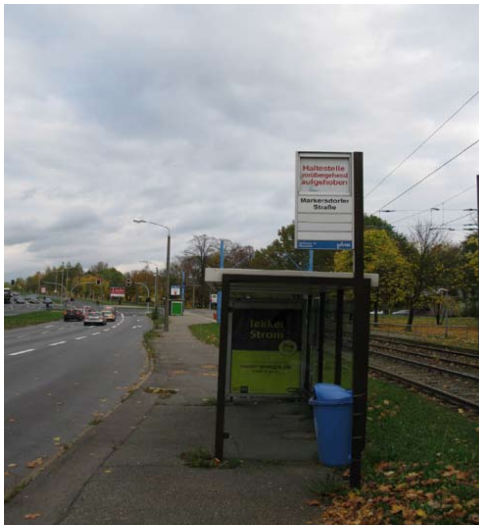
Umsteigen von Buslinie 22 auf Bahnlinie 5 ist an der Haltestelle Markersdorfer Straße nicht mehr möglich