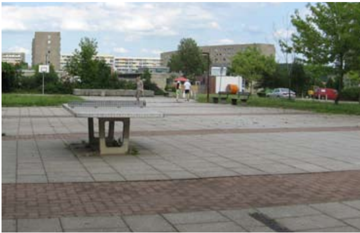
Die Umgestaltung der Stadtteilmitte Markersdorf, Alfred-Neubert-Straße, ist 2008 leider noch nicht erfolgt.