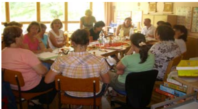
Beratung des pädagogischen Teams mit dem Elternrat der Kita

Prüfer der Freien Universität Berlin haben im Juni 2008 einen Tag lang sechs Erzieherinnen in vier Gruppen bei ihrer Arbeit begleitet. Beobachtet und bewertet wurden dabei die Betreuung und Pflege der Kinder, die Ausstattung der Gruppenräume, Aktivitäten zur Förderung der Kinder, sprachlich-kognitive Anregungen für die Kinder, Interaktion zwischen den Kindern sowie Kindern und Erziehern, die Strukturierung