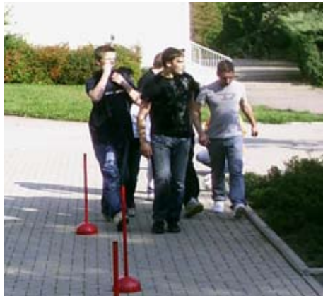
Neben der Attraktion Menschen-Kicker galt es auch andere Teamspiele zu probieren.

Am 27.09. letzten Jahres fand im Nachgang zur Fußball-EM unter Federführung der Mobilien Jugendarbeit am Klub „Würfel“ ein Menschen-Kicker-Rallye-Turnier für alle Kinder und Jugendlichen statt. Einzige Bedingung: man musste zwischen 1,40 und 2 m groß sein, um in einer Art Riesen-Tischfußball mit menschlichen Spielern mit kicken zu können. Teams zu je sechs Mitgliedern kämpften dabei um die Stadtteilmeisterschaft. Den Pokal, den das Team vom KJH Compact gewann, und die vielen Preise wurden dankenswerterweise von Firmen gesponsert