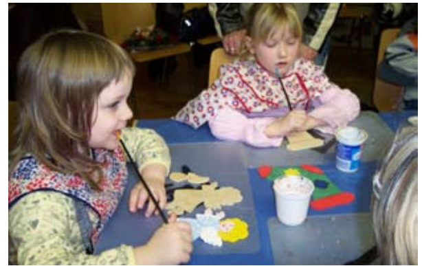
Kinder basteln Weihnachtsgeschenke.

Besucher etwas dabei. Ein großer Dank geht hiermit noch einmal an die Organisatoren und allen beteiligten Einrichtungen und ehrenamtlichen Helfer des Weihnachtsmarktes, die dafür gesorgt haben, dass es auch 2008 wieder hieß „Gahr fer Gahr geht's zen Advent offn...“ Hutholzer Weihnachtsmarkt – und warten schon gespannt auf eine neue Auflage 2009.